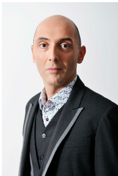
portrait : © Christel Mauve